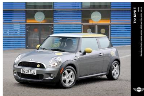
BMW Mini-E

Dal luglio 2009 questo progetto pilota è stato realizzato a Monaco in una cooperazione tra la BMW e la compagnia elettrica E.ON. L'energia che serve per la e-car è prevalentemente idro-elettricità. L'obiettivo del progetto pilota è di guadagnare esperienze per quanto riguarda le esigenze alle quali devono rispondere i fornitori e l'uso del mezzo.