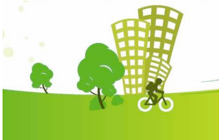
“EXOIKONOMO” programma per Comuni in Grecia

Il primo giro di domande è stato completato alla fine di luglio 2009 ed è previsto l'avvio dei progetti accettati prima della fine del 2009. Questo programma si rivolge ad amministrazioni locali con più di 10.000 abitanti. A seconda del numero di abitanti residenti, un certo catalogo e certe categorie di misure sono richiesti per ogni proposta di progetto per essere valutato e approvato.