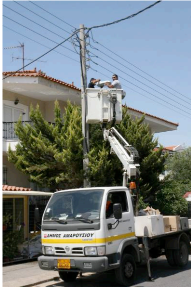
La sostituzione di vecchie lampade ad Amaroussion

Inoltre l' acquisto a larga scala (2.500 lampade) ha contribuito a una riduzione del prezzo di mercato fino al 46% .